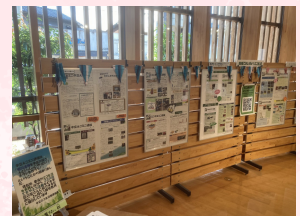
※京エコロジーセンター、上京まつりでも展示予定