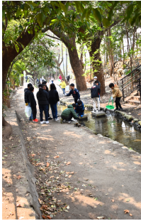
ホタルの生育場所