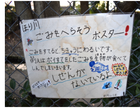
掲出されているポスター